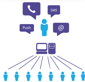
Sistema VIPER MASS